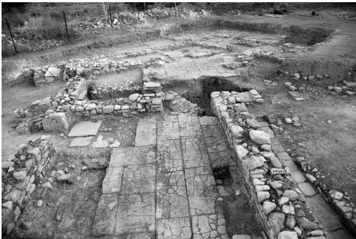
Fig. 2 - Veduta generale del grande edificio a N della strada