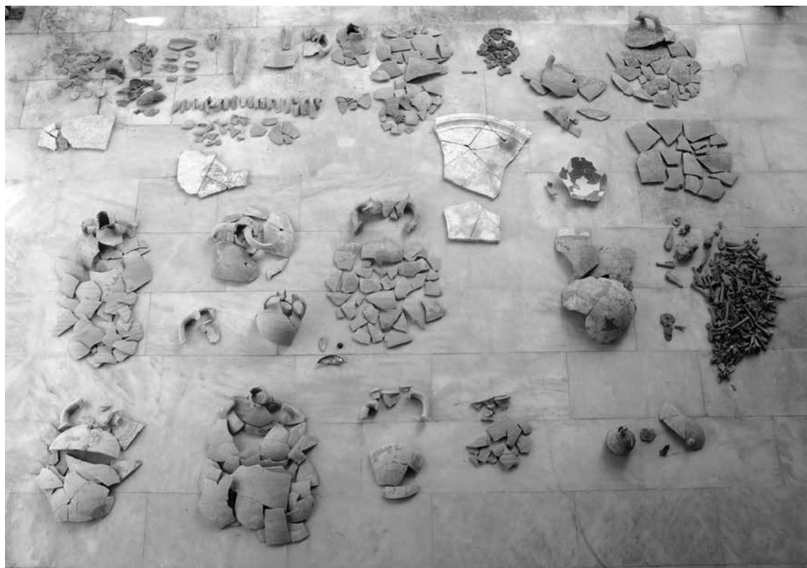
Fig. 5 - Selezione dei reperti mobili recuperati al di sotto dei crolli del grande edificio

Nell'insieme, dunque, i reperti coperti dal crollo (e in parte probabilmente trasportati da crollo stesso) nel cortile consentono di confermare l'immagine generale di un edificio collegato a un esponente o a una funzione di élite nel contesto della Gortina protobizantina e di assegnare al crollo una cronologia a partire dagli anni iniziali dell'VIII secolo (senza che sia possibile precisare meglio il limite inferiore di questa cronologia). Per contro, la presenza di apprestamenti precari e di resti di ovicaprini uccisi in situ dal crollo testimonia la coesistenza di questa immagine 'alta' suggerita dai reperti mobili con una realtà complessa, fatta anche di ricovero di animali nel cortile della stessa casa 11 , aprendo lo spazio per una riflessione sull'effettiva natura e immagine delle élites urbane della Gortina protobizantina nell'estrema fase della sua vita urbana.