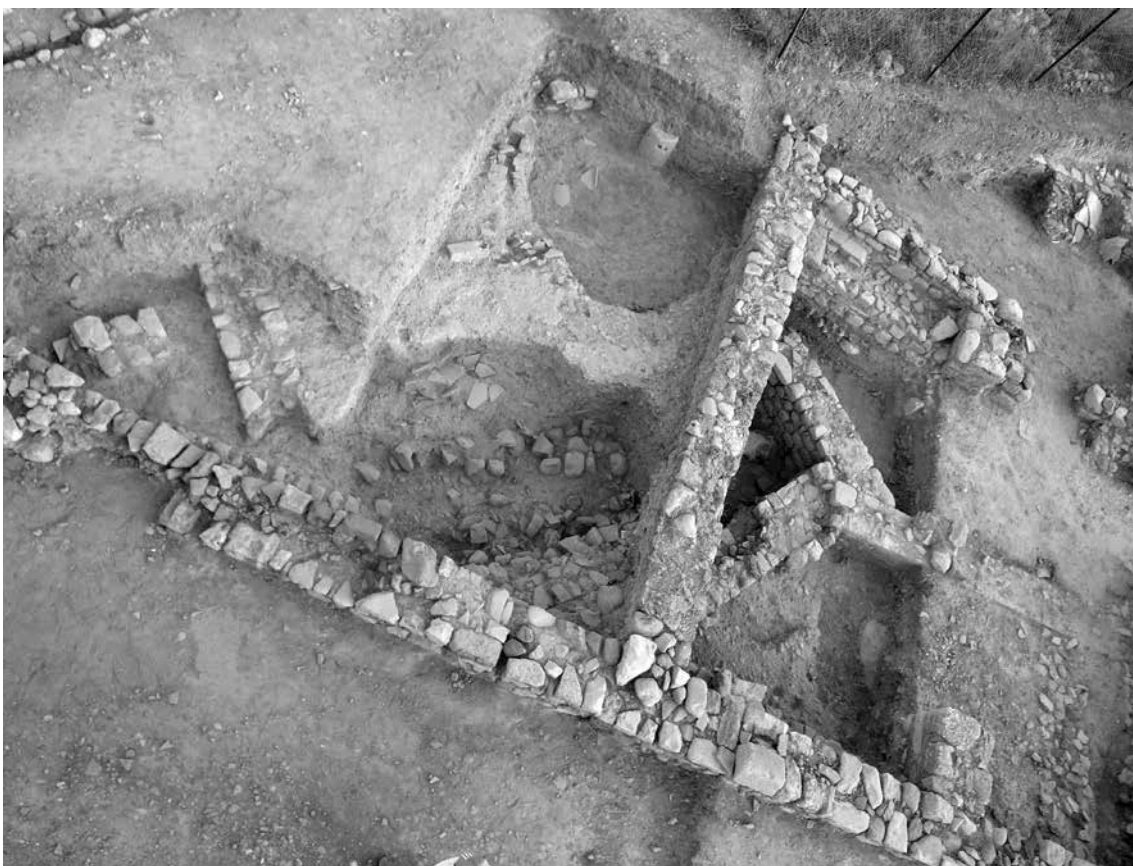
Fig. 4 - Veduta zenitale dei resti relativi al tessuto urbano di epoca romana e tardoantica cancellato dalla costruzione del grande edificio a N della strada